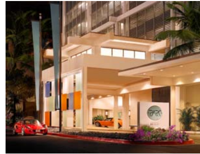
(ワイキキパーク全景)

ワイキキの目抜き通りであるカラカウア通りは、全米有数の高級ブランド街として生まれ変わりました。また、「ワイキキ・ビーチ・ウォーク」には、おしゃれなショップやレストラン、エンターティメント施設が数多く誕生しています。新しく生まれ変わったワイキキパークホテルで多彩なアクティビティをお楽しみください。