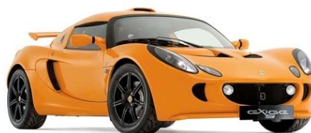
(ロータス・エキシージS)

高級レンタルスポーツカー「ロータスエリゼ」「ロータス・エキシージS」をレンタカーとしてご利用(有料)になれます。GPS機能や携帯電話が設備され、オアフ島一周のドライブも心配ご無用です。