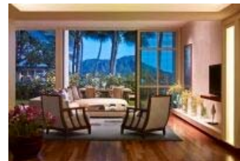
(オーキッドスイート)