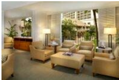
(ホスピタリティ・スイート)

2008 年に、コンシェルジュデスク、ホスピタリティスイート、ロビーエリア、リビングルームなどの、パブリックスペースの改装を実地いたしました。ハレクラニのオリジナルコンセプトを残しつつ、時代に合わせ洗練されたインテリアにリフレッシュし、さらにお客様の利便性を向上いたしました。