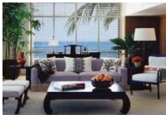
(ヴェラ・ワン・スイート)

新設された「オーキッドスイート」とともに、究極のおもてなしをご提供するスイートがプレミアスイートです。この3つのスイートは、それぞれに意匠を凝らした内装と、贅を尽くした主寝室を備えています。さらに客室やテラスからは、ワイキキビーチと壮大なダイヤモンドヘッドの美しい景色もご堪能いただけます。