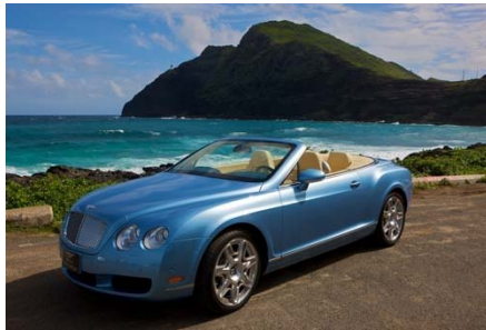
(ベントレーコンチネンタル GTC)

走る芸術品と呼ぶにふさわしいカスタムメイドの高級車、ベントレーコンチネンタル GTC、マセラティグラントゥーリズモ、ロータスエキシージ S、ロータスエリーゼがオーキッドスイートお泊まりのお客様は無料でご利用いただけます。