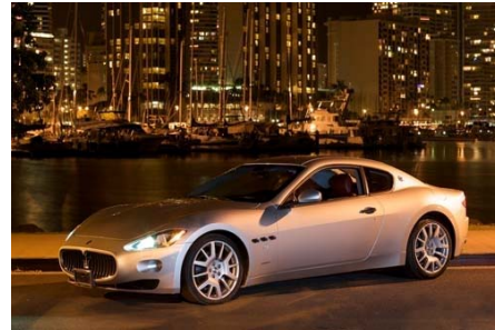
(マセラティグラントゥーリズモ)