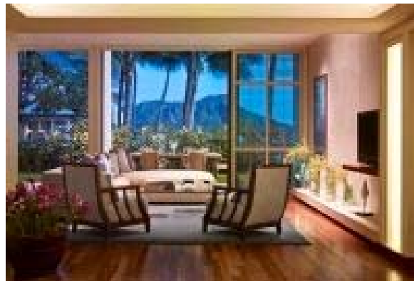
(オーキッドスイート)

ハレクラニの象徴であるオーキッドの名前をもつプレミアムスイート「オーキッドスイート」を新設いたしました。「オーキッドスイート」からはダイヤモンドヘッドの見事な景観や、グレイズ・ビーチが望めます。グレイズ・ビーチは、「地下から湧き出る海水が高いヒーリング効果を持つ、特別な場所である」と古くから地元の人に伝えられている、まさにオールド・ハレクラニを体験できる空間です。ハレクラニのラグジュアリーなエクスペリエンスをご堪能いただけます。